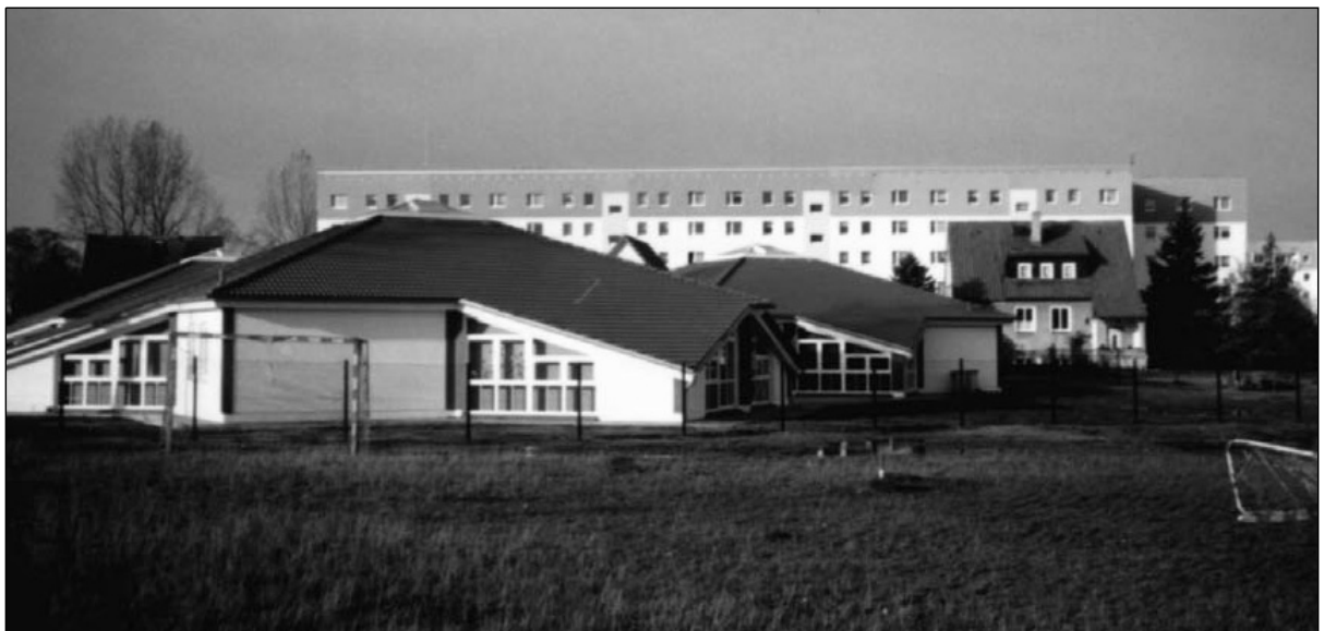
Ansicht der Kindertagesstätte in Graal-Müritz