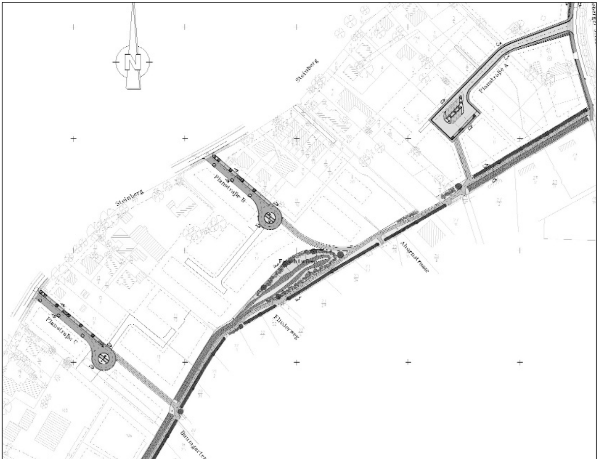
Gesamtübersicht Erschließungsgebiet B-Plan Nr.68 "Wieden" in Wedel